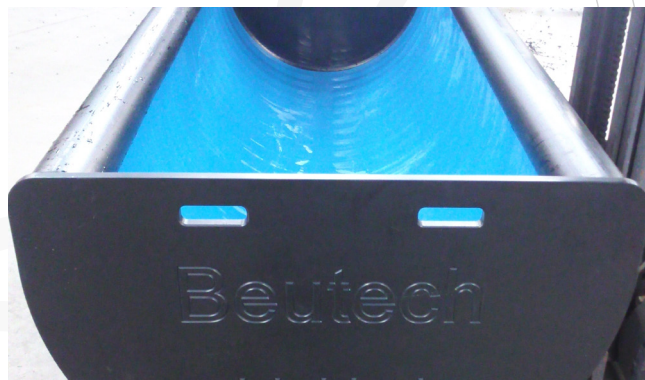
PE Drink- en voerbak