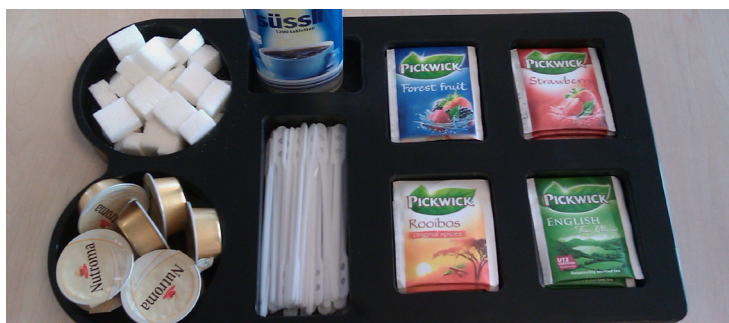
Koffie- en theebakje